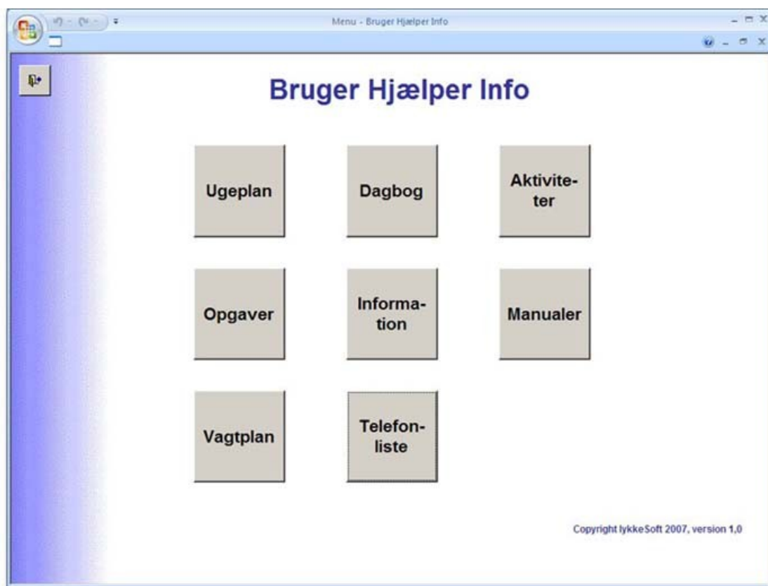
Figur 1: Ved opstart af Bruger Hjælper Info kommer ovenstående hovedmenu frem

IT for PALS Dummies er en artikel serie som henvender sig til os med ALS. For at overleve er vi hele tiden nødt til at være på forkant med viden om de nyeste IT hjælpemidler, og der findes heldigvis et utal af muligheder. Jeg har, sammen med nogle af mine ALS venner, været med i en film om kommunikations hjælpemidler og var forbløffet over der findes så mange forskellige IT løsninger. Derfor er det også umuligt at have styr på alt hvad der rør sig i IT junglen, men jeg vil skrive om nogen af de emner jeg ved lidt om. I al beskedenhed handler min første artikel i serien om et computer program jeg selv har lavet. Jeg har de sidste fem år haft hjælpere ansat men haft store problemer med kommunikationen til dem. Jeg kan ikke tale, men jeg kan bruge en computer. Før jeg fik sygdommen arbejdede jeg som systemudvikler og har derfor stor viden om udvikling af programmer. Den viden har jeg brugt til at lave et kommunikations program til hjælperne og mig. Programmet hedder Bruger Hjælper Info og her kommer en kort beskrivelse af programmet.